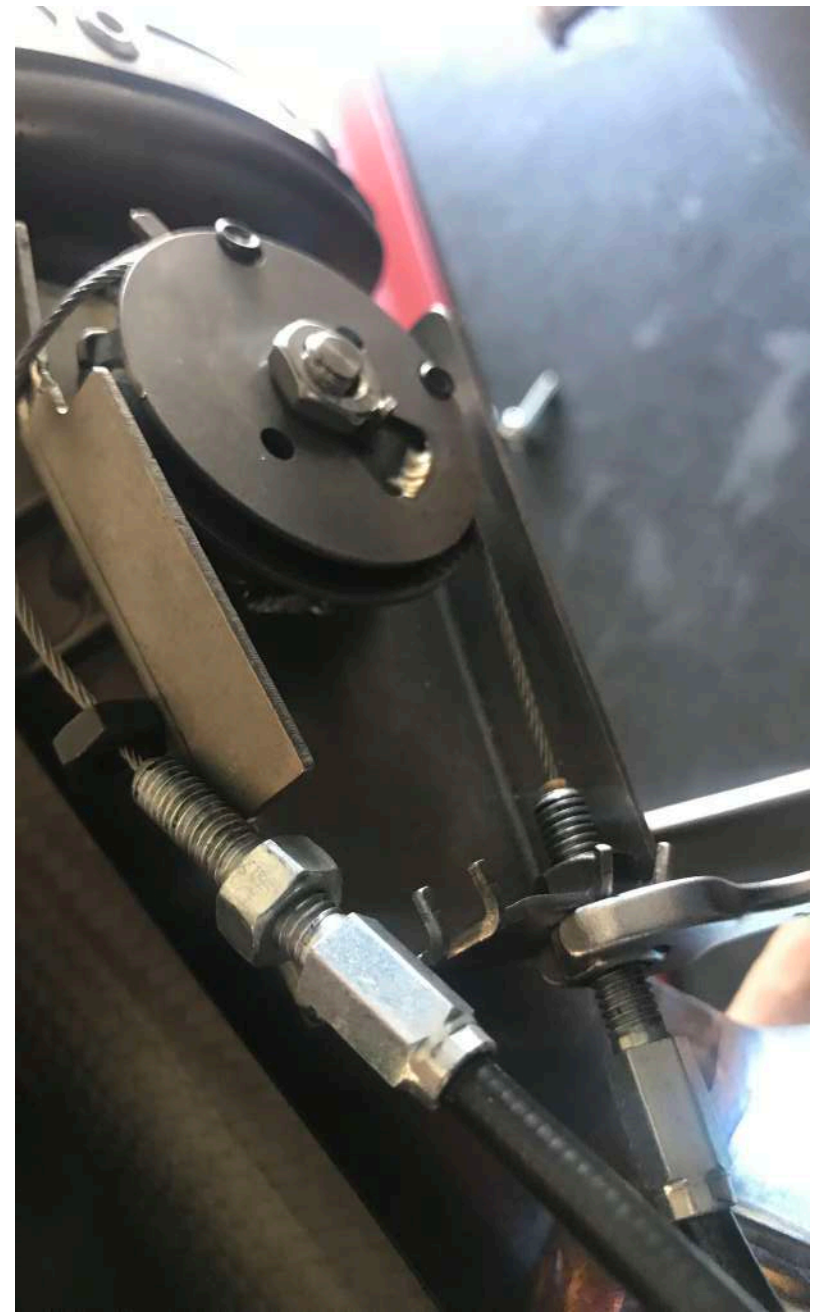
Rimuovere entrambi i cavi dalla valvola originale allentando i 2 bulloni / Loosen the nuts and remove the valve cables