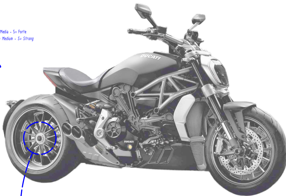
Immagine usata a fini esclusivamente illustrativi Image used for illustrative purposes only

Lubrificare ✓ / Lubricate ✓ Non lubrificare ✗ / Do not lubricate ✗ Solo primi filetti ◆ / First threads only ◆