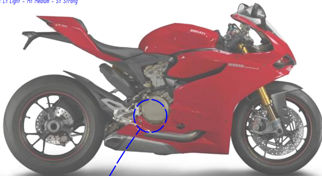
Immagine usata a fini esclusivamente illustrativi Image used for illustrative purposes only

Bloccare con frenafili: L= Leggera - M= Media - S= Forte Lock with the threadlocker: L= Light - M= Medium - S= Strong