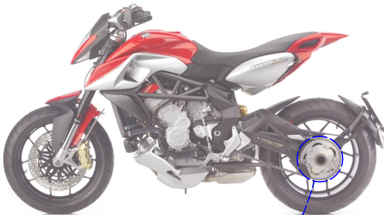
Immagine usata a fini esclusivamente illustrativi Image used for illustrative purposes only

ATTENZIONE: Il montaggio del prodotto deve essere eseguito da personale specializzato WARNING: The mounting of the product it must be realized from staff specialist