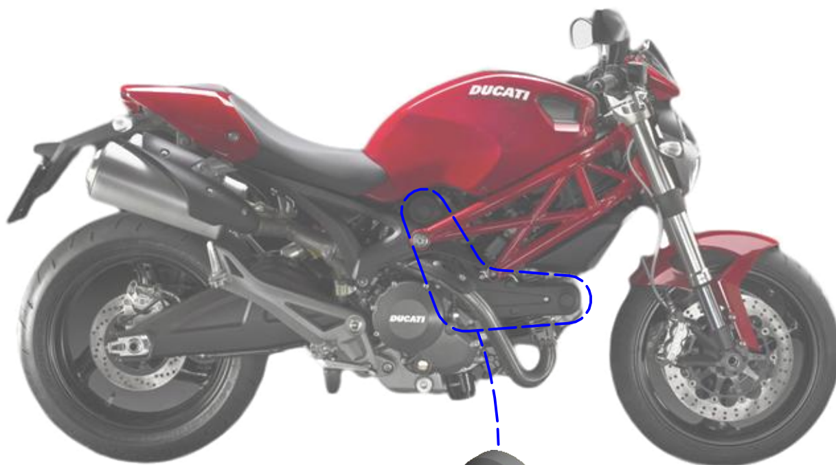
Immagine usata a fini esclusivamente illustrativi Image used for illustrative purposes only

ATTENZIONE: Il montaggio del prodotto deve essere eseguito da personale specializzato WARNING: The mounting of the product it must be realized from staff specialist