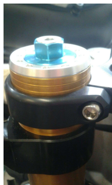
Piastra di sterzo Melotti Racing Melotti Racing top fork bridge

Extraction to be detected with Melotti Racing top fork bridge: 9.7 mm