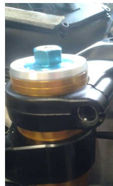
Piastra di sterzo Aprilia Aprilia top fork bridge

L'ufficio tecnico è a disposizione per qualsiasi ulteriore informazione.