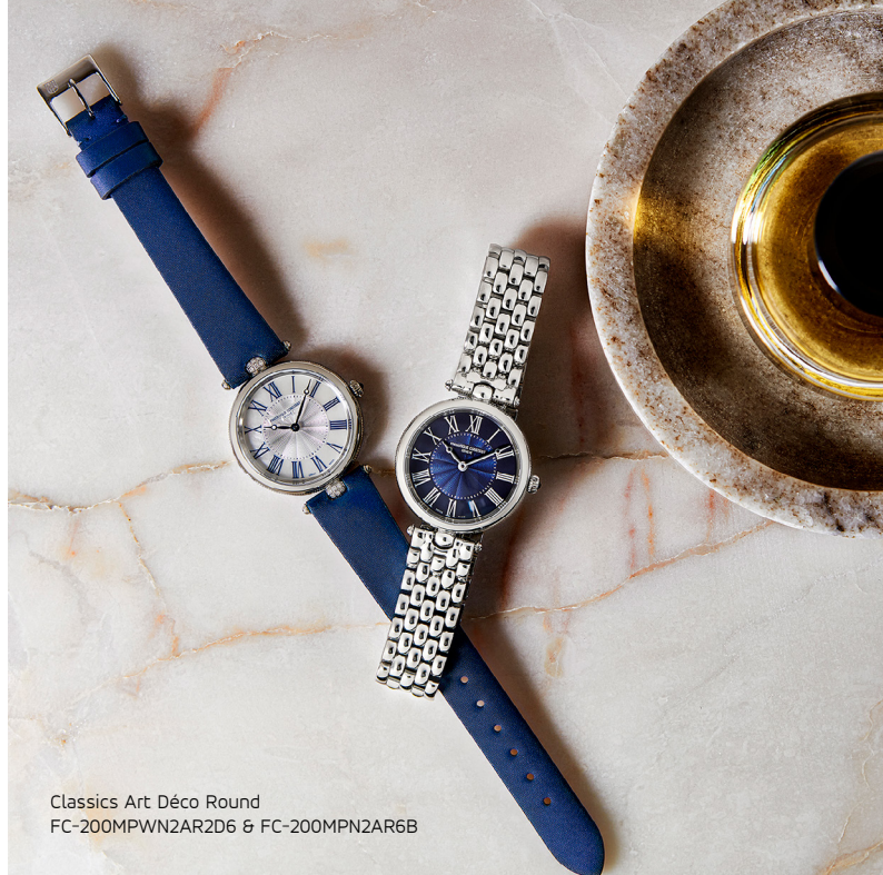
Classics Art Déco Round FC-200MPWN2AR2D6 & FC-200MPN2AR6B