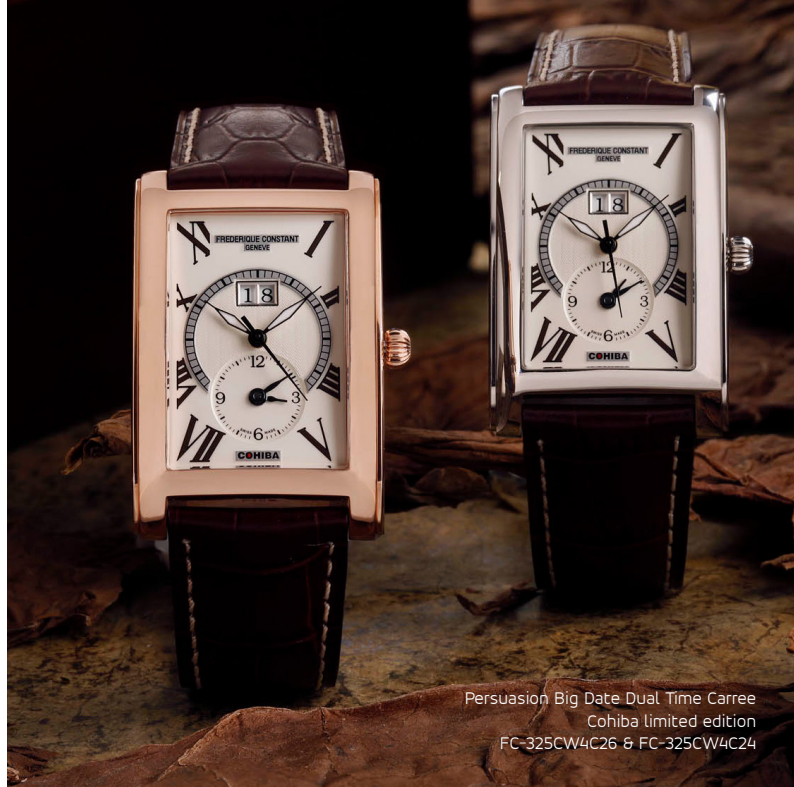
Persuasion Big Date Dual Time Carree Cohiba limited edition FC-325CW4C26 & FC-325CW4C24