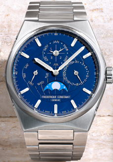
Highlife Perpetual Calendar Manufacture FC-775N4NH6B