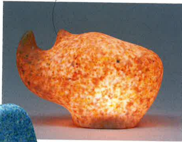
De Rhinolamp kwam er ter ere van de bedreigde witte neushoorn.

school hun meubilair kunnen gebruiken. Maar misschien komt dat nog in de toekomst?"