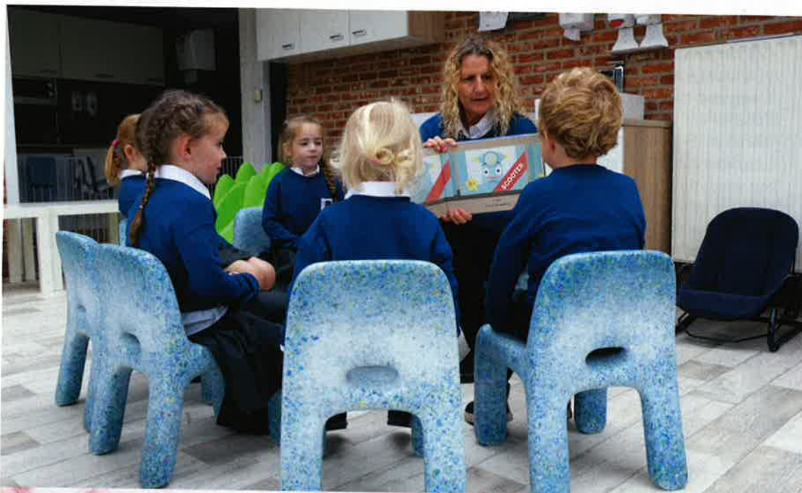
De Charliestoeltjes van ecoBirdy worden volop in de klasjes van de MondoMioschool gebruikt.