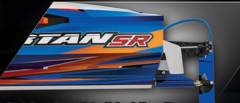
Stainless-Steel Trim Tabs & Turn Fins