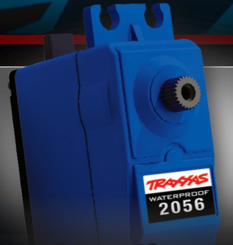
High-Torque Waterproof Servo