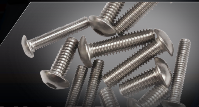
Stainless Steel Hex Hardware