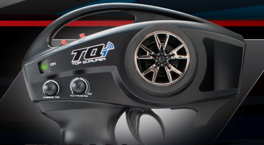
TQi® 2.4GHz Radio System