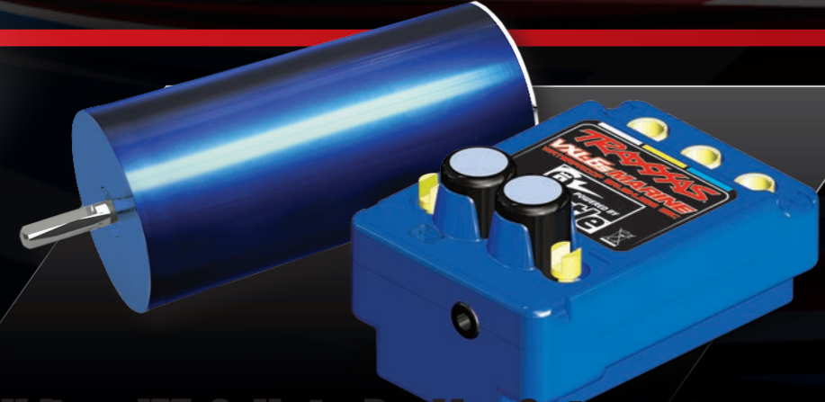
Velineon VXL-6s Marine Brushless System