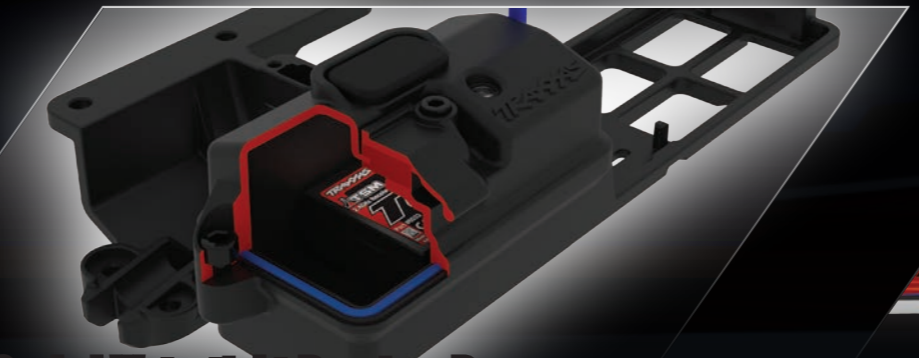
Sealed Watertight Receiver Box