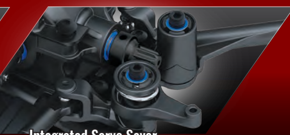
Integrated Servo Saver