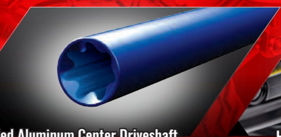
Extruded Aluminum Center Driveshaft