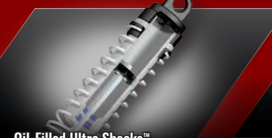
Oil-Filled Ultra Shocks™