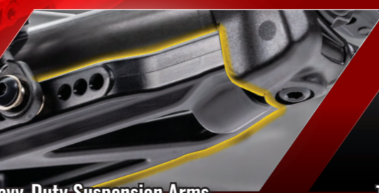
Heavy-Duty Suspension Arms