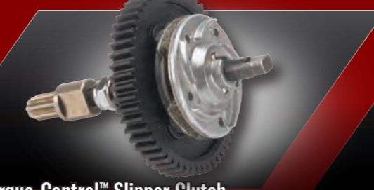
Torque-Control™ Slipper Clutch