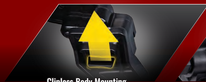
Clipless Body Mounting