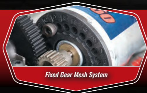
Fixed Gear Mesh System