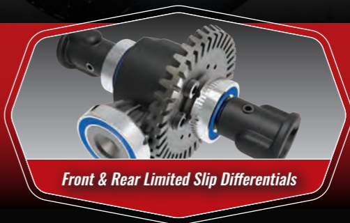
Front & Rear Limited Slip Differentials