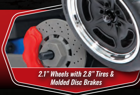
2.1" Wheels with 2.8" Tires & Molded Disc Brakes