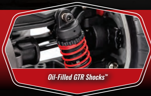
Oil-Filled GTR Shocks™