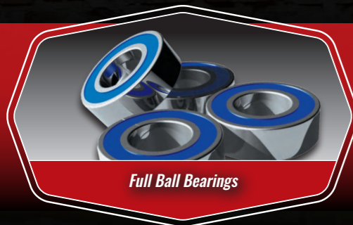
Full Ball Bearings