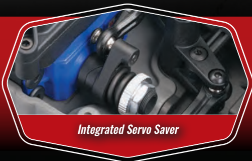
Integrated Servo Saver