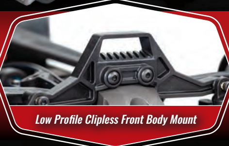
Low Profile Clipless Front Body Mount