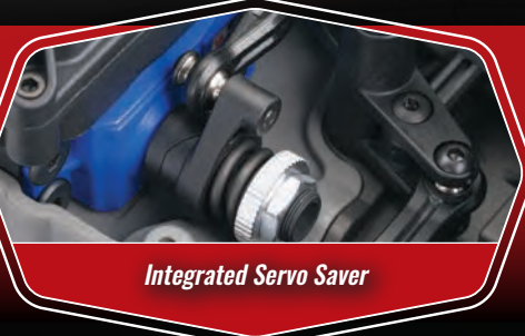
Integrated Servo Saver