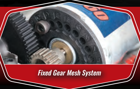
Fixed Gear Mesh System