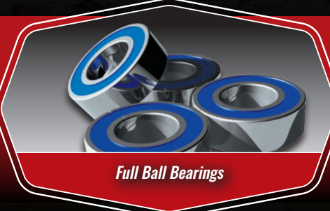
Full Ball Bearings