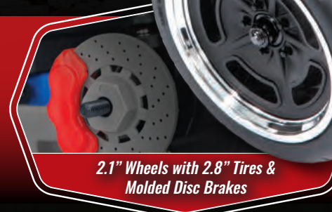
2.1" Wheels with 2.8" Tires & Molded Disc Brakes