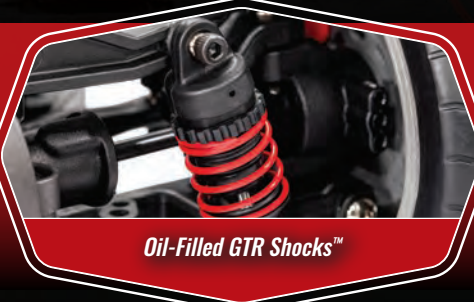
Oil-Filled GTR Shocks™