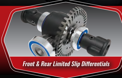
Front & Rear Limited Slip Differentials