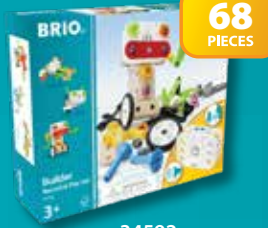
34587 Builder Construction Set