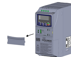
(a) Removal of the communication accessory cover (a) Remoción de la tapa de accesorios de comunicación (a) Remoção da tampa de acessórios de comunicação