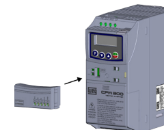
(b) Accessory connection (b) Conexión del accesorio (b) Conexão de acessório