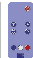
Figure 1: Remote control (infrared)

(*) Function available when SoftPLC application is installed. Otherwise, this key has no function.