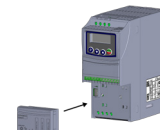
(b) Accessory connection (b) Conexión del accesorio (b) Conexão do acessório