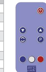
Figure 1: Control remoto (infrarrojo)

(*) Función disponible cuando existe aplicativo SoftPLC instalado. En caso contrario, esta tecla no posee ninguna funcionalidad.