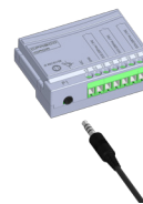
(c) IR receiver connection (c) Conexión de receptor IR (c) Conexão do receptor IR