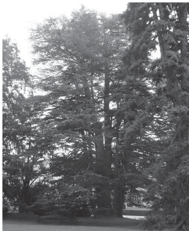
Ejemplares de cedro libanés en España. El cedro libanés es la especie elogiada en los libros de Anastasia por las virtudes de su aceite.

De los nueve libros, este artículo solo trata algunos temas de los tres primeros: Anastasia , Ringing Cedars of Russia y Space of Love . La propia Anastasia, su abuelo y tatarabuelo hablan con Vladimir Megré sobre infinidad de temas, pero según Megré hay dos en especial de los que Anastasia habla con Amor: Tierra y Niños. Sin contar, por supuesto, los Cedros, sobre los cuales leemos en todos los libros y sobre cuyas aplicaciones aprendemos. Resultan útiles para la salud espiritual, emocional y física del ser humano, pues su aceite "cura cualquier enfermedad sin contraindicaciones".