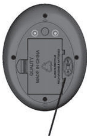
ON - OFF Switch interruptor de encendido y apagado

Suspend from a hook or wire using the hanger accessory Suspender de un gancho de alambre o con el accesorio colgador