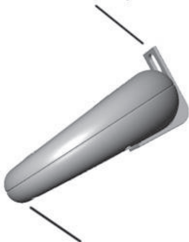
Weep hole (drain) - DO NOT OBSTRUCT Orificio de desagüe (drenaje) - no obstruir

Suspend from a hook or wire using the hanger accessory Suspender de un gancho de alambre o con el accesorio colgador