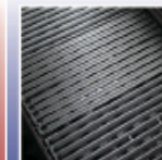
Grilaj robust din fontă Flav-R-Cast