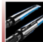
Sistem de arzătoare Dual-Tube™ din oțel inoxidabil