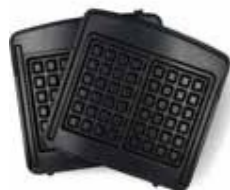
Placă pentru vafe Liège (Bruxelles)