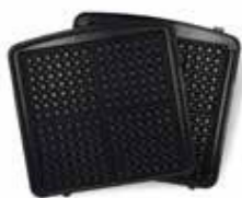
Placă pentru vafe clasice belgiene