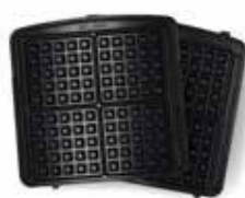
Placă pentru Vafe

(Cumpărați plăcile suplimentare pentru vafe belgiene potrivite pentru acest Aparat pentru vafe!)