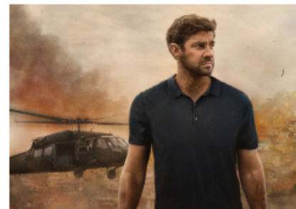
PUBLICITÉ Amazon Jack Ryan – Saison 2

A LIRE AUSSI : La pyjama party de la mode A partir de 120 euros, www.milajack.com