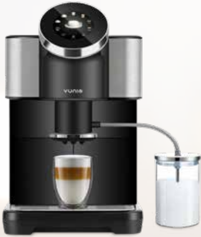
YUNIO H2 zwart