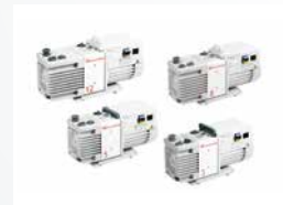
RV Two Stage Rotary Vane Pumps