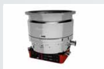
STP Maglev Turbomolecular Pumps