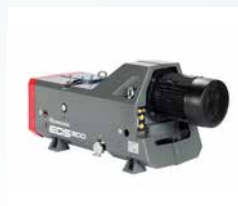
Industrial Dry Pumps