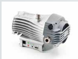
Dry Scroll Pumps