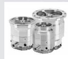
Industrial Turbomolecular Pumps

Next-level vacuum performance with best-in-class pumping speeds.