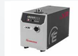
nXRi Multistage Roots Pumps