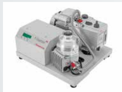
Turbomolecular Pumping Stations