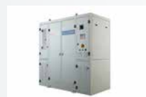
Environmental Solutions - Abatement