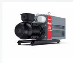
Oil Sealed Pumps