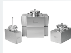
Ultra High Vacuum Pumps