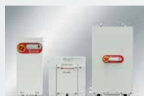
Semiconductor Dry Pumps