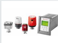
Measurements & Controls