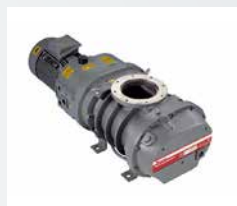
Mechanical Booster Pumps