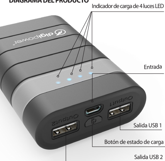
DIAGRAMA DEL PRODUCTO