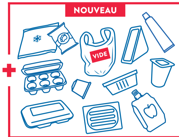
TOUS LES AUTRES EMBALLAGES EN PLASTIQUE ET MÉTAL (ACIER, ALU...)

LES BOUCHONS ET COUVERCLES SONT ACCEPTÉS. LES EMBALLAGES DOIVENT ÊTRE BIEN VIDÉS ET EN VRAC! PAS BESOIN DE LES LAVER.