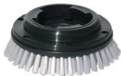
26-160-01570000 Brosse Nylon Ø230 - 0,5mm