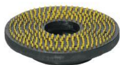
26-160-01570900 Plateau Picots Ø230