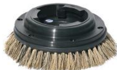
26-160-01570200 Brosse Créole Ø230