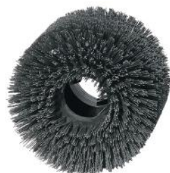
26-160-01570400 Brosse Cylindrique Tynex Ø260 - 1,1mm