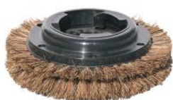
26-160-01570800 Brosse Créole Ø260