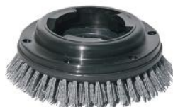
26-160-01570100 Brosse Tynex Ø230 - 1,1mm