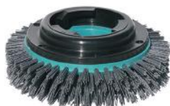
26-160-01570700 Brosse Tynex Ø260 - 1,1mm