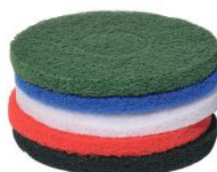
26-170-01571000 Pads - Ø254