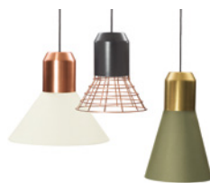
BELL LIGHT PENDANT LAMP 2013