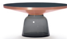
BELL COFFEE TABLE COPPER 2013 Special Edition