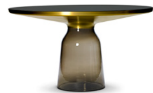
BELL HIGH TABLE 2020