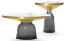
Quarzgrau quartz grey Marmor marble Bianco Carrara

Hand-blown glass base in various colours. Metal top frame solid brass with clear varnish. Tabletop crystal glass, black lacquered, or tabletop marble in various versions, polished and impregnated.