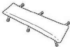
Thermo pad X1SB97