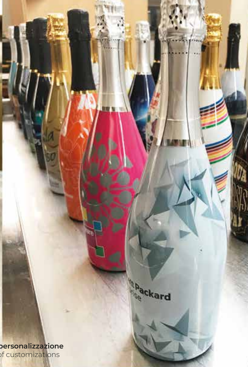
• Esempi di personalizzazione • Examples of customizations