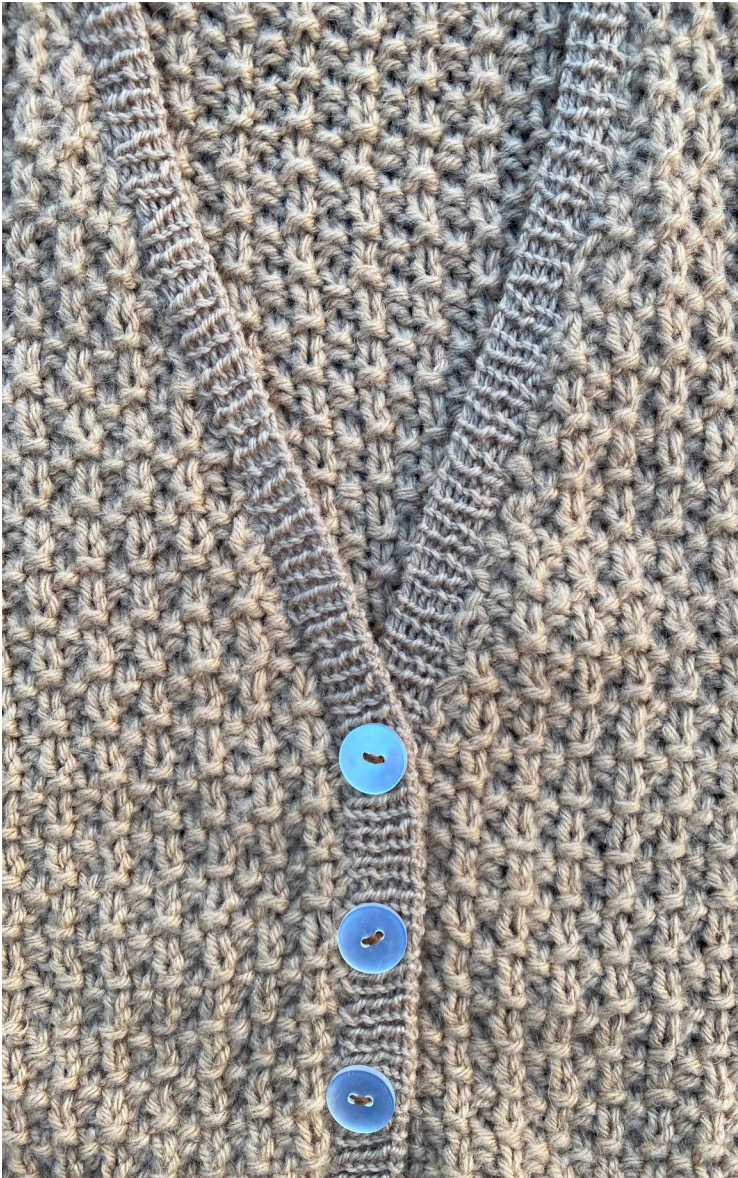
DIAGRAMA PUNTO FANTASÍA