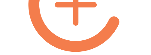
A 1 alcohol wipe €€