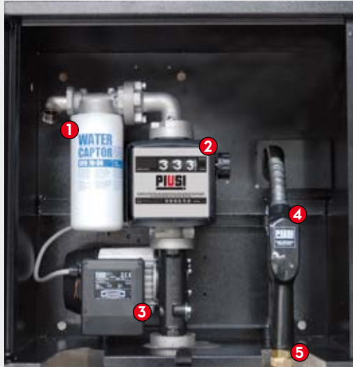
ST BOX Basic