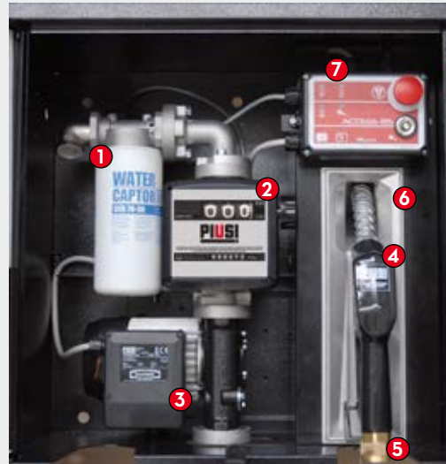
ST BOX Pro