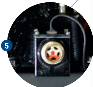
LOW OIL SHUTDOWN APAGADO CON BAJO NIVEL DE ACEITE