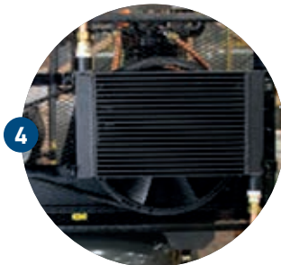
BELTGUARD AFTERCOOLER POS RESFRIADOR MONTADO NO PROTECTOR DE CORREA