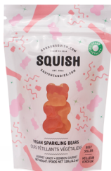
Ours pétillants végétales