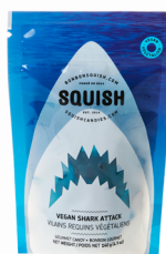
Vilains requins végétales