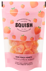
Cœurs à la pêche acidulés