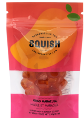
Mangue et maracuja