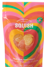
Cœurs à la pêche acidulé végétales