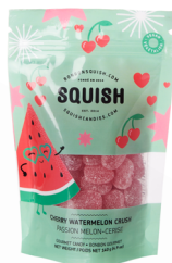
Passion melon-cerise végétalienne