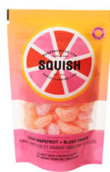
Pamplemousse et orange sanguine acidulé végétales