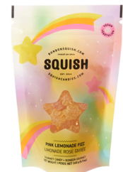
Limonade rose givrée végétalienne