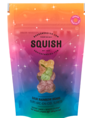
Ours arc-en-ciel végétales