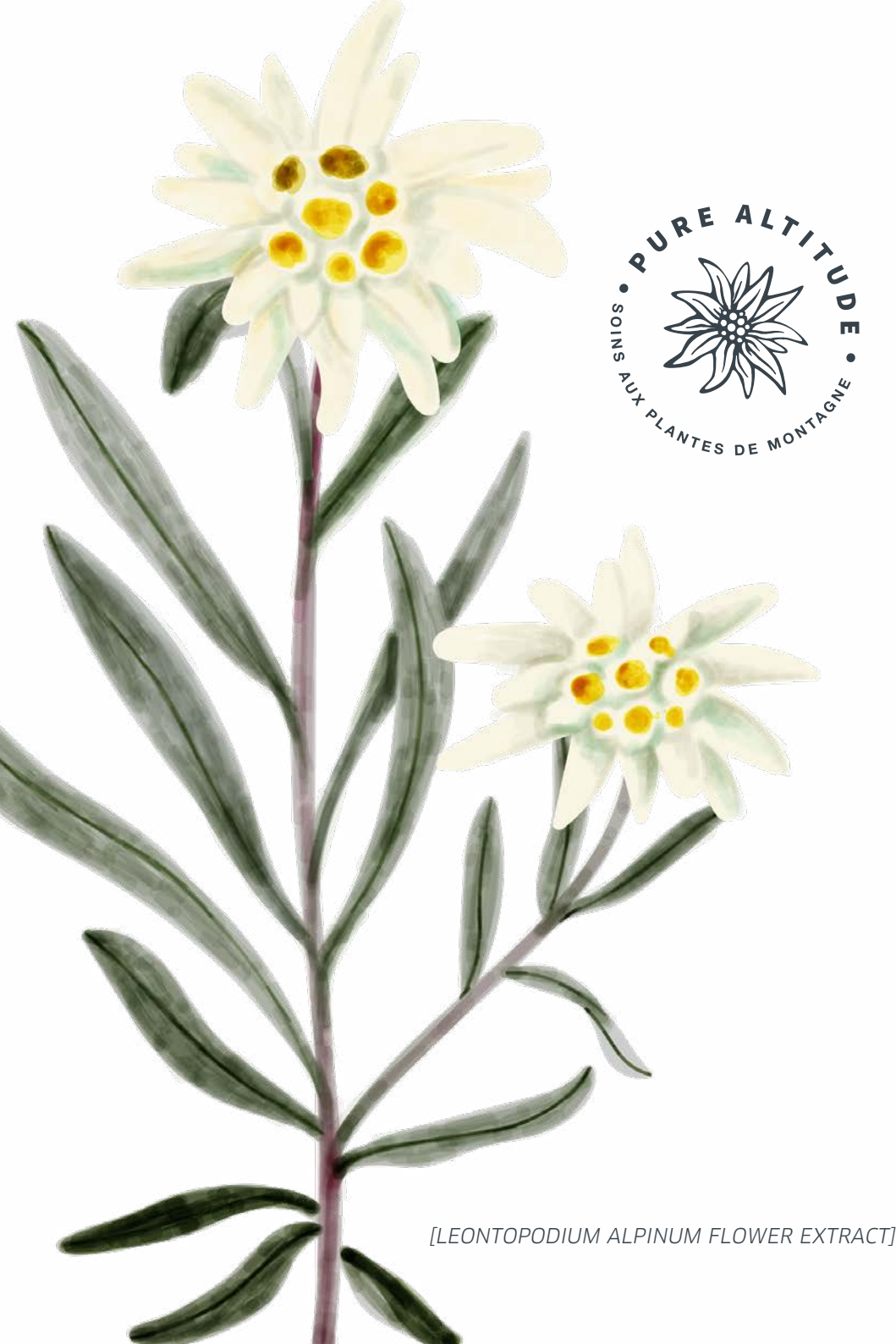
[LEONTOPODIUM ALPINUM FLOWER EXTRACT]