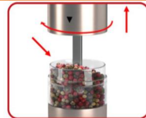
3. BEFÜLLEN DER MÜHLE

Legen Sie 4 AAA-Batterien (nicht im Lieferumfang enthalten) unter Beachtung der Polarität in das Batteriefach ein.