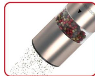
6. VERWENDUNG VON MÜHLE

Sie den Regler im Uhrzeigersinn für feineres Mahlen, gegen den Uhrzeigersinn - für grobkörniges Mahlen.