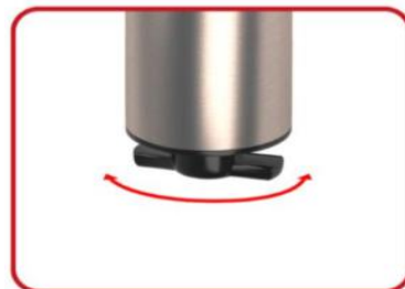
5. EINSTELLUNG DES MAHLGRADES

Verbinden Sie das Gewürzfach mit dem Gerätegehäuse, indem Sie den Zeiger in die Position "geschlossenes Schloss" bewegen. Montieren Sie auf die gleiche Weise die Batterieabdeckung.