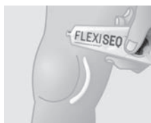
Apply the gel evenly around the joint.