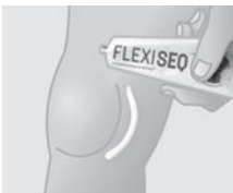
Das Gel gleichmäßig um das Gelenk auftragen.