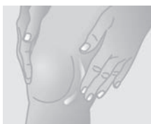
Evenly cover the soft tissue at the front and the back of the joint (do not apply to the knee cap).