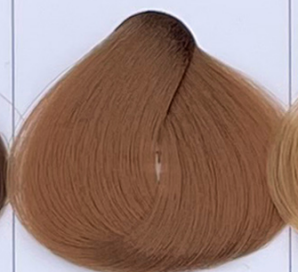
golden dune duna dorata