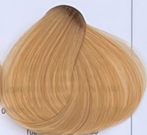
very light golden blonde biondo chiarissimo dorato