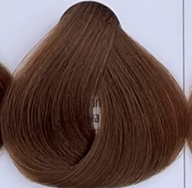
caramel cream crème caramel