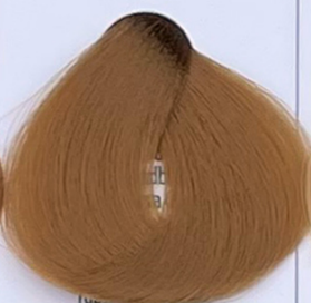
light golden blonde biondo chiaro dorato