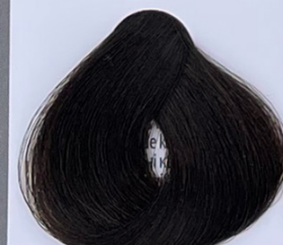
chestnut spread marrons glacé