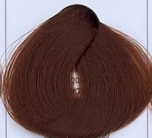
dark golden blonde biondo scuro dorato