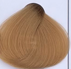
golden sand sabbia dorata