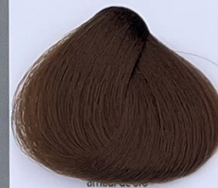
golden amber ambrata dorata