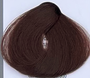
light golden chestnut castano chiaro dorato