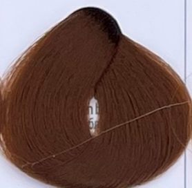
golden blonde biondo dorato