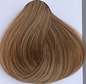
nutmeg noce moscata