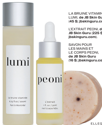
LA BRUINE VITAMINÉE LUMI, de JB Skin Guru (45 $; jbskinguru.com).