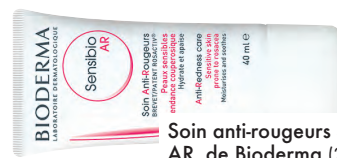
Soins anti-rougeurs Sensibio AR, de Bioderma (28 $).