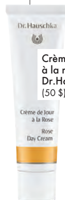
Crème de jour à la Rose, de Dr. Hauschka (50 $).