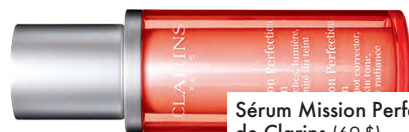
Sérum Mission Perfection, de Clarins (69 $).