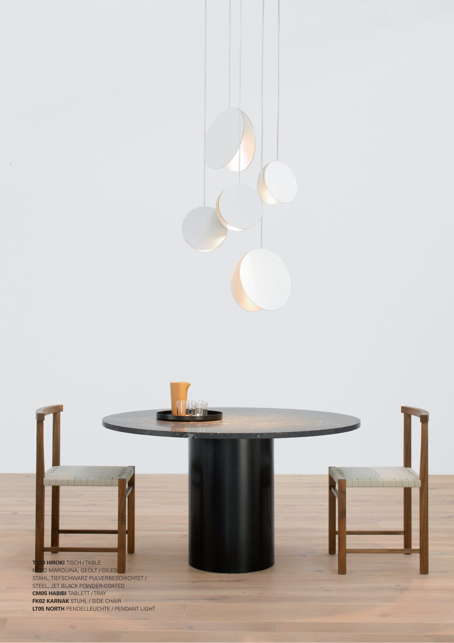
T020 HIROKI TISCH / TABLE NEBO MARQUINA, GEÖLT / OILED STAHL, TIEFSCHWARZ PULVERBESCHICHTET / STEEL, JET BLACK POWDER-COATED CM05 HABIBI TABLETT / TRAY FK02 KARNAK STUHL / SIDE CHAIR LT05 NORTH PENDELLEUCHE / PENDANT LIGHT