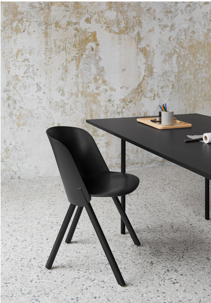
TA14 ANTON TISCH / TABLE EICHE, GEBEIZT, TIEFSCHWARZ, LACKIERT / OAK, STAINED, JET BLACK LACQUERED STAHL, TIEFSCHWARZ PULVERBESCHICHTET / STEEL, JET BLACK POWDER-COATED CH05 THIS STUHL / SIDE CHAIR AC19 SALINA STEINZEUG / STONEWARE