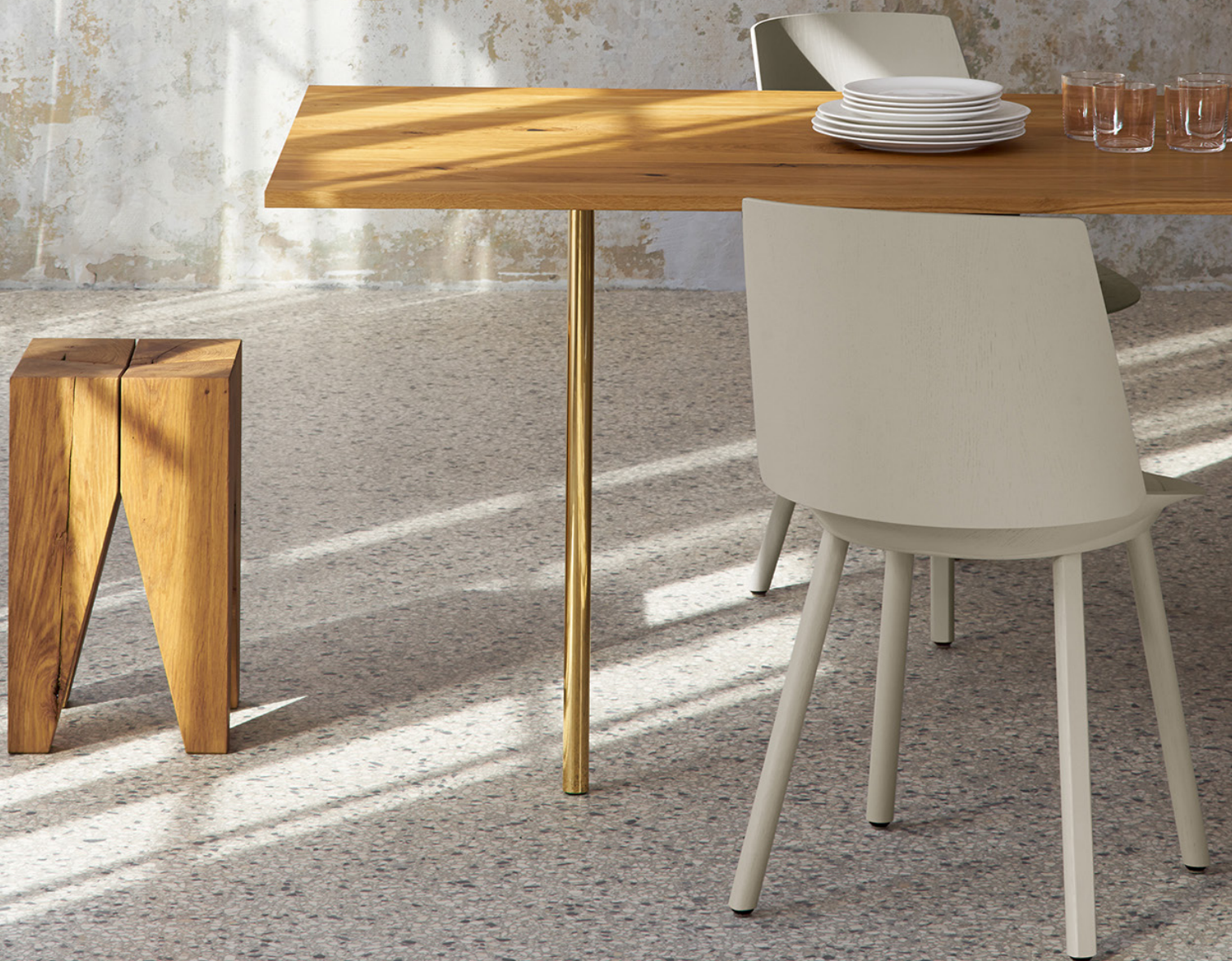
TA14 ANTON TISCH / TABLE EICHE, GEÖLT / OAK, OILED MESSING, POLIERT / BRASS, POLISHED ST04 BACKENZAHN™ HÖCKER / STOOL CH04 HOUDINI STUHL / SIDE CHAIR