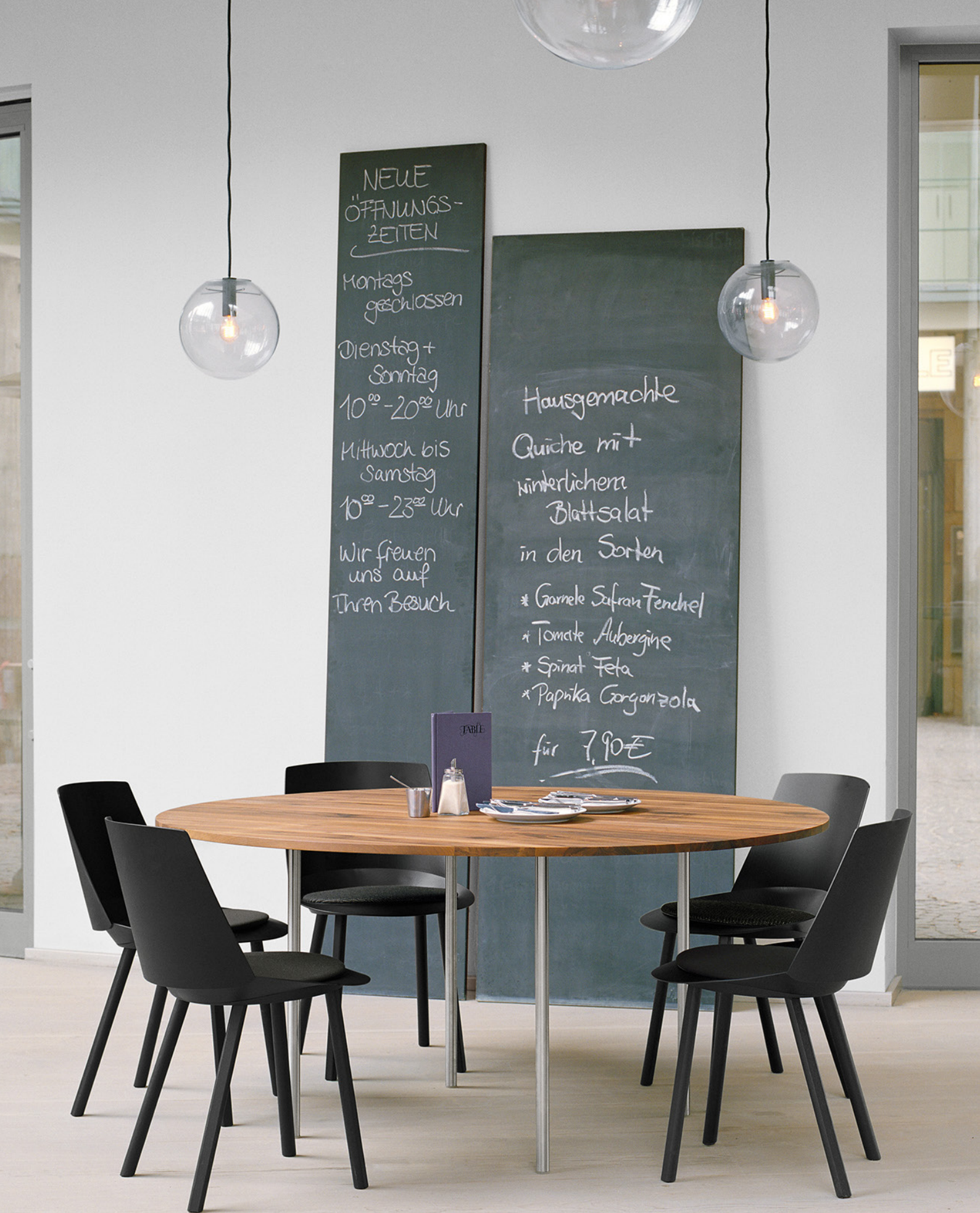
TA14 ANTON TISCH / TABLE NUSSBAUM, GEÖLT / WALNUT, OILED EDELSTAHL, GESCHLIFFEN / STAINLESS STEEL, BRUSHED CH04 HOUDINI STUHL / SIDE CHAIR