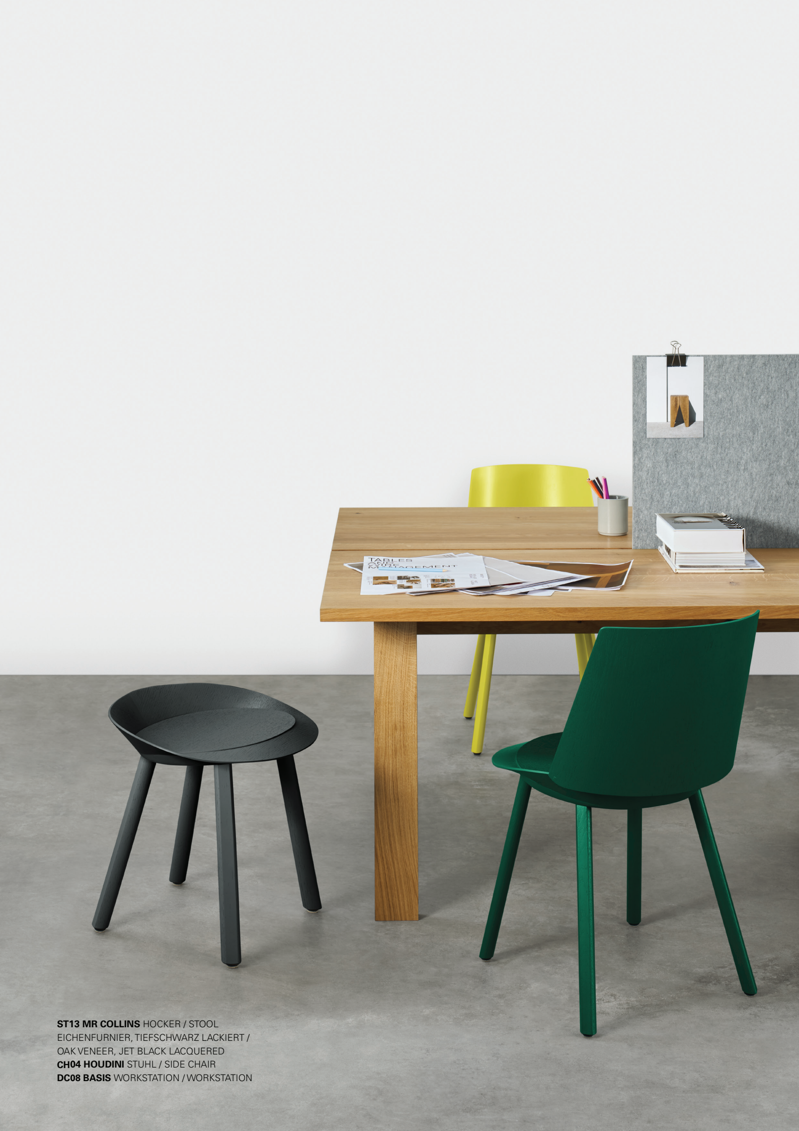
ST13 MR COLLINS HOCKER / STOOL EICHENFURNIER, TIEFSCHWARZ LACKIERT / OAK VENEER, JET BLACK LACQUERED CH04 HOUDINI STUHL / SIDE CHAIR DC08 BASIS WORKSTATION / WORKSTATION