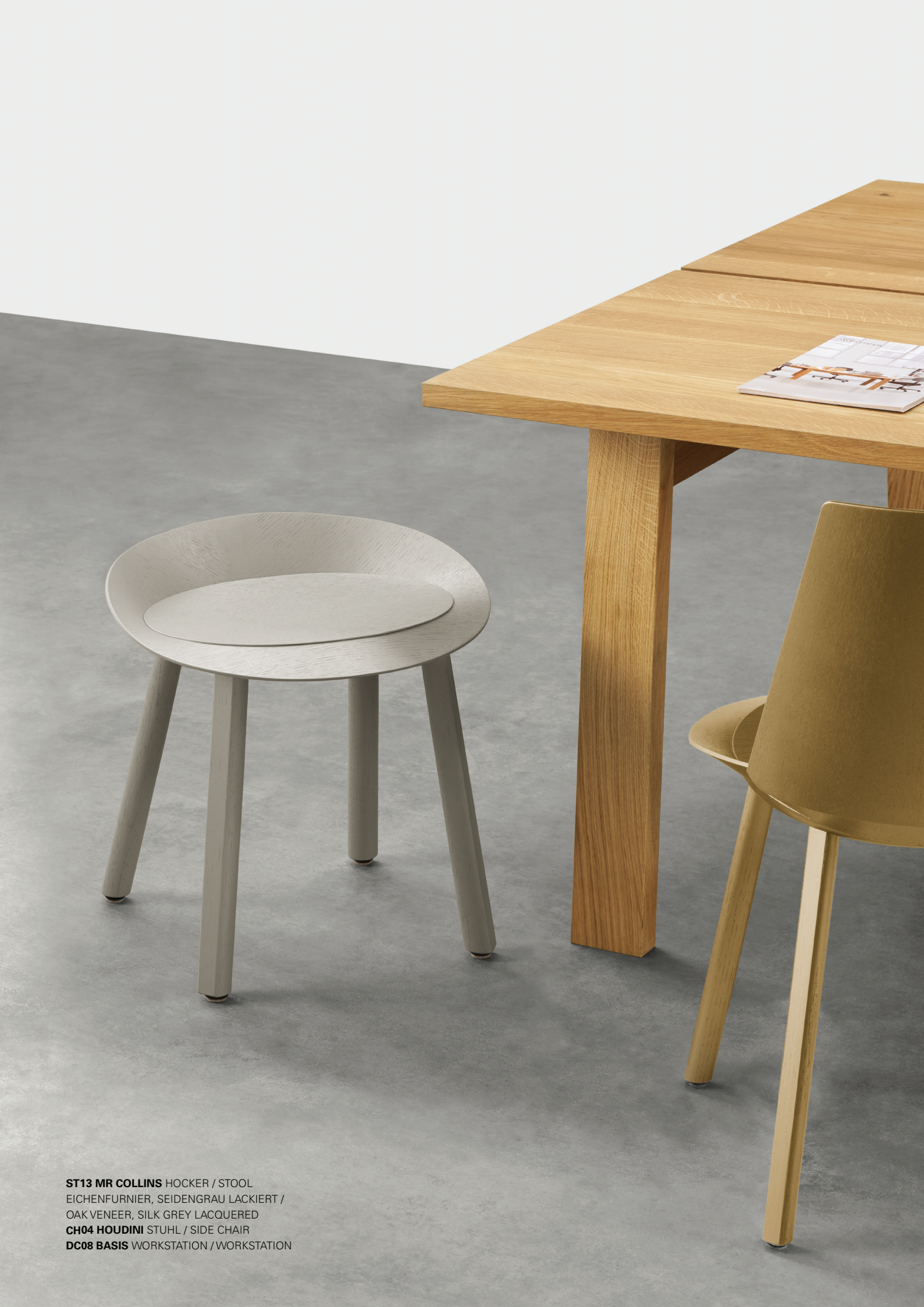
ST13 MR COLLINS HOCKER / STOOL EICHENFURNIER, SEIDENGRAU LACKIERT / OAK VENEER, SILK GREY LACQUERED CH04 HOUDINI STUHL / SIDE CHAIR DC08 BASIS WORKSTATION / WORKSTATION