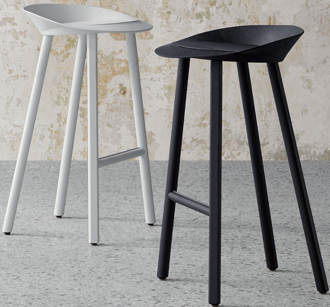
ST10 JEAN HOCKER / STOOL EICHENFURNIER, SIGNALWEISS, TIEFSCHWARZ LACKIERT / OAK VENEER, SIGNAL WHITE, JET BLACK LACQUERED