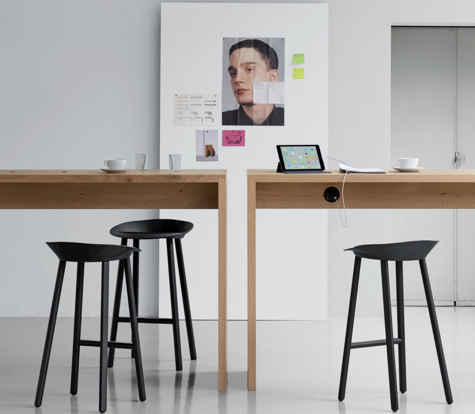
ST10 JEAN HOCKER / STOOL EICHENFURNIER, TIEFSCHWARZ, KLAR LACKIERT / OAK VENEER, JET BLACK, CLEAR LACQUERED TA01 PONTE STEHTISCH / HIGH TABLE