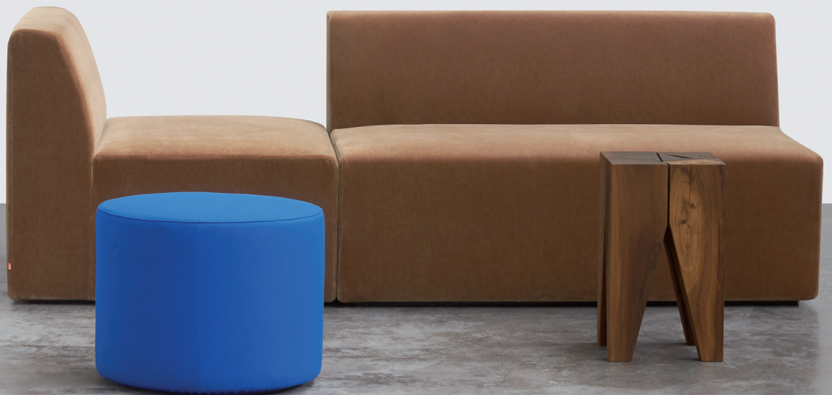
SH01 MATE REGAL / SHELF EICHE, GEÖLT / OAK, OILED SF06 KERMAN SOFA / SOFA ST04 BACKENZAHN™ HOCKER / STOOL