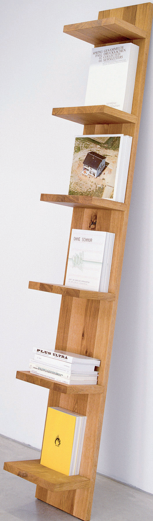
SH01 MATE REGAL / SHELF EICHE, GEÖLT / OAK, OILED