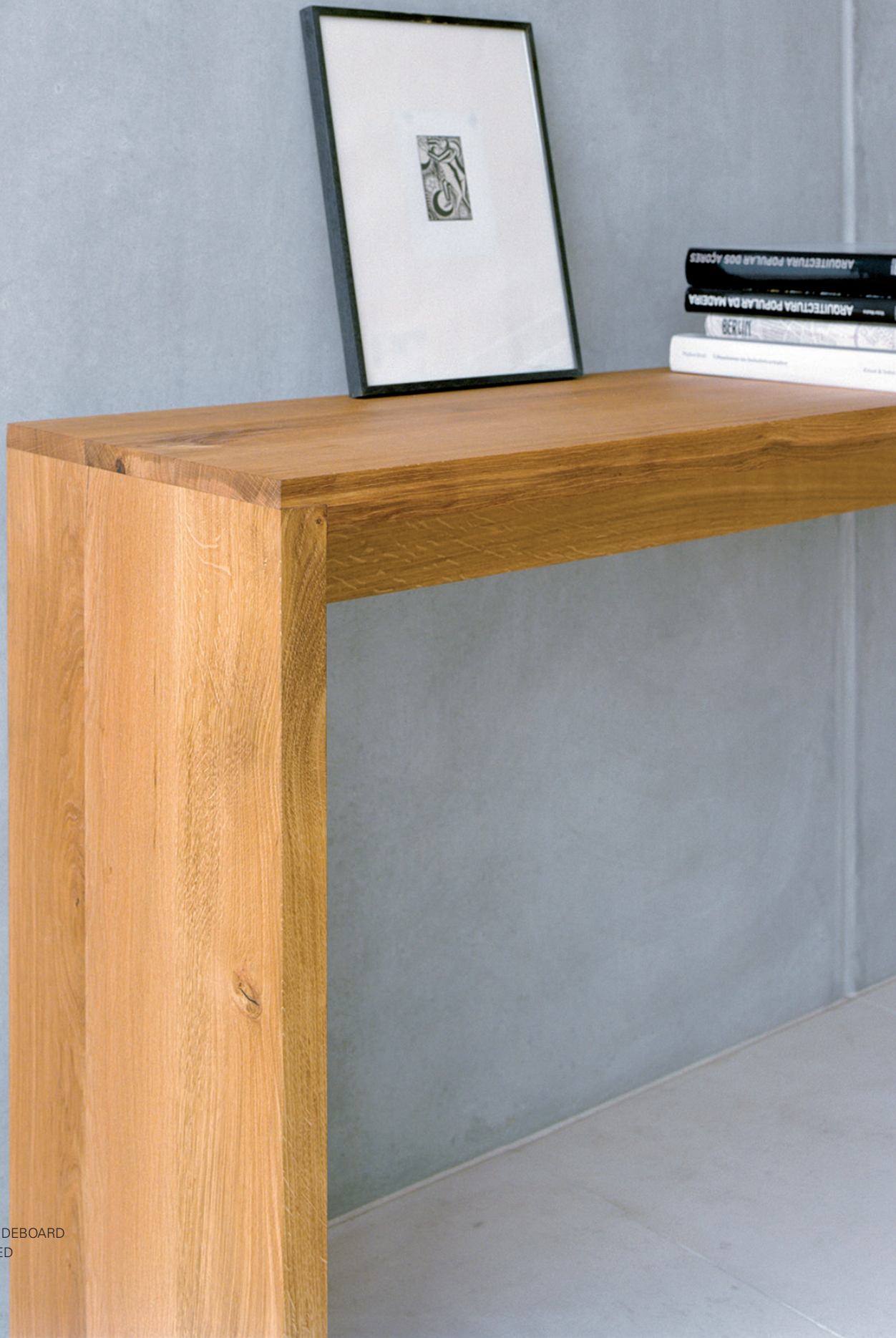
SB01 ALTO ANRICHTE / SIDEBOARD EICHE, GEÖLT / OAK, OILED