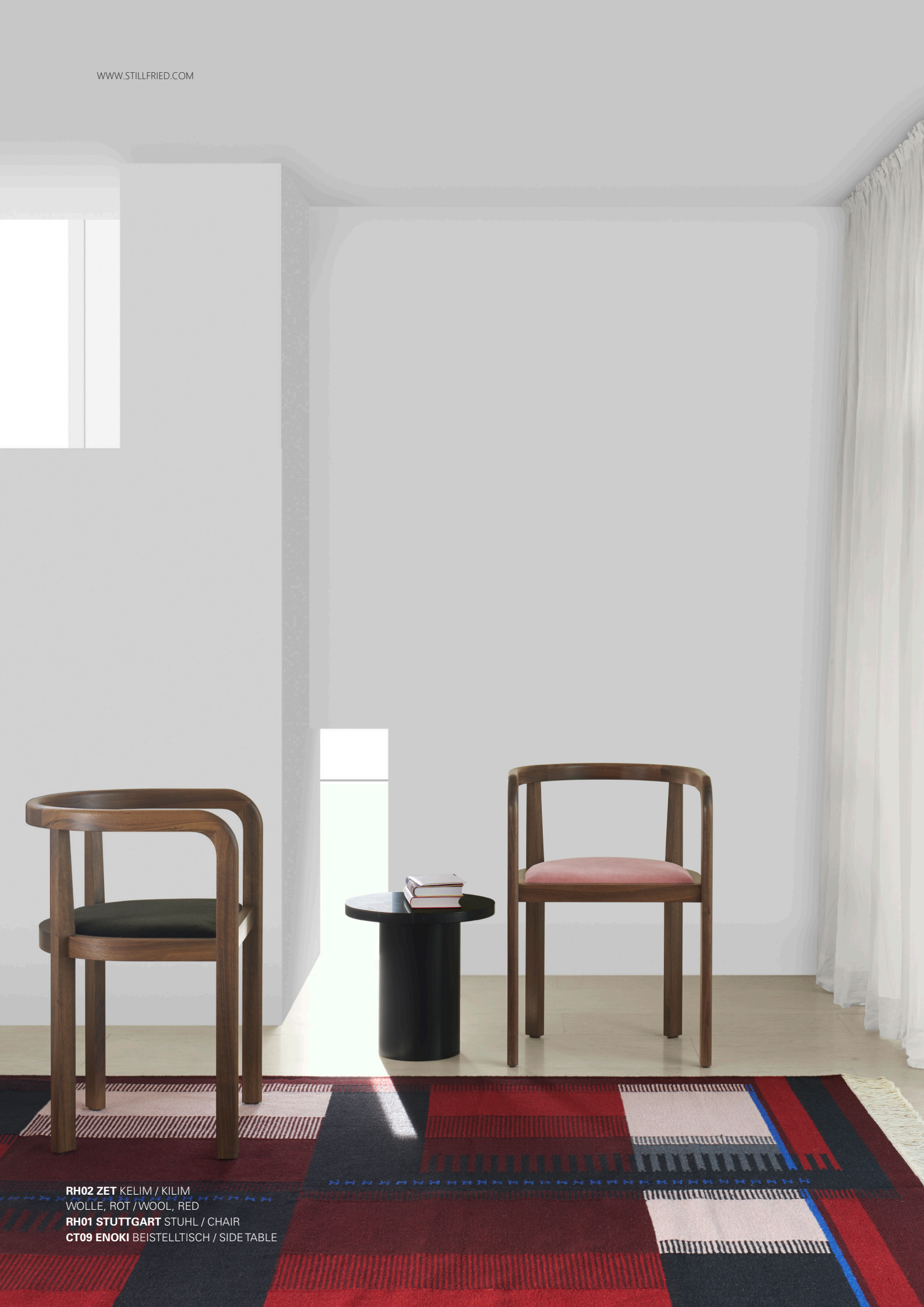
RH02 ZET KELIM / KILIM WOLLE, RÖT / WOOL, RED RH01 STUTTGART STUHL / CHAIR CT09 ENOKI BEISTELLTISCH / SIDE TABLE