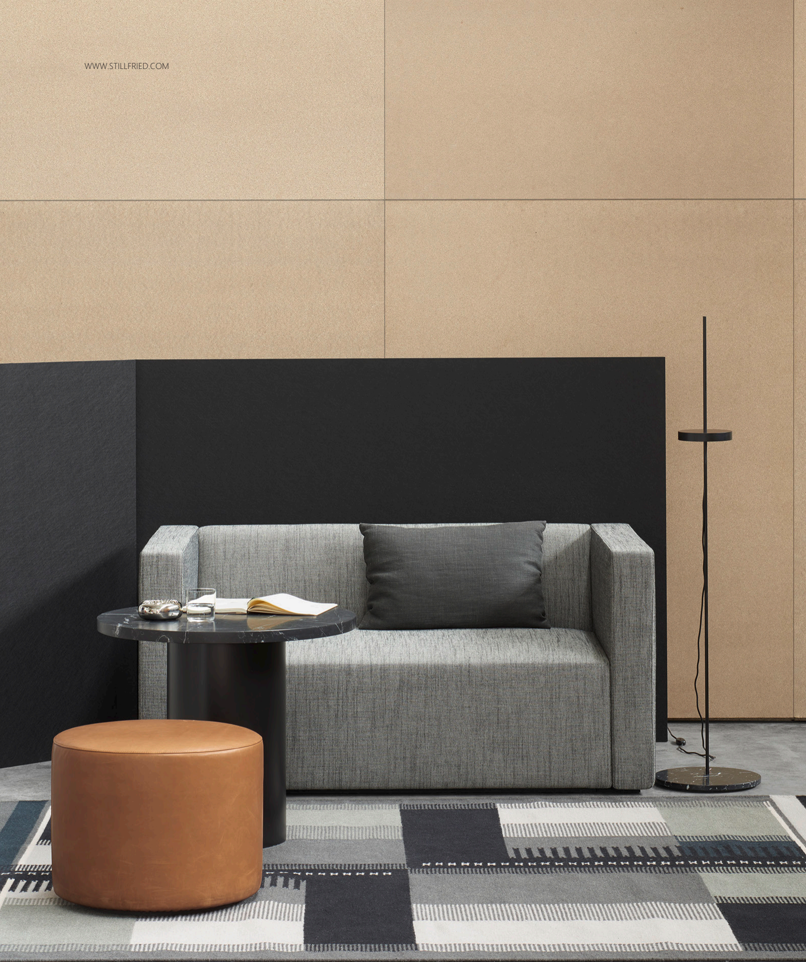
RH02 ZET KELIM / KILIM WOLLE, GRAU / WOOL, GREY SF06 KERMAN SOFA / SOFA SF06 KERMAN POUF / POUF LT06 PALO BODENLEUCHE / FLOOR LIGHT CT09 ENOKI BEISTELLTISCH / SIDE TABLE CU06 NIMA KISSEN / CUSHION