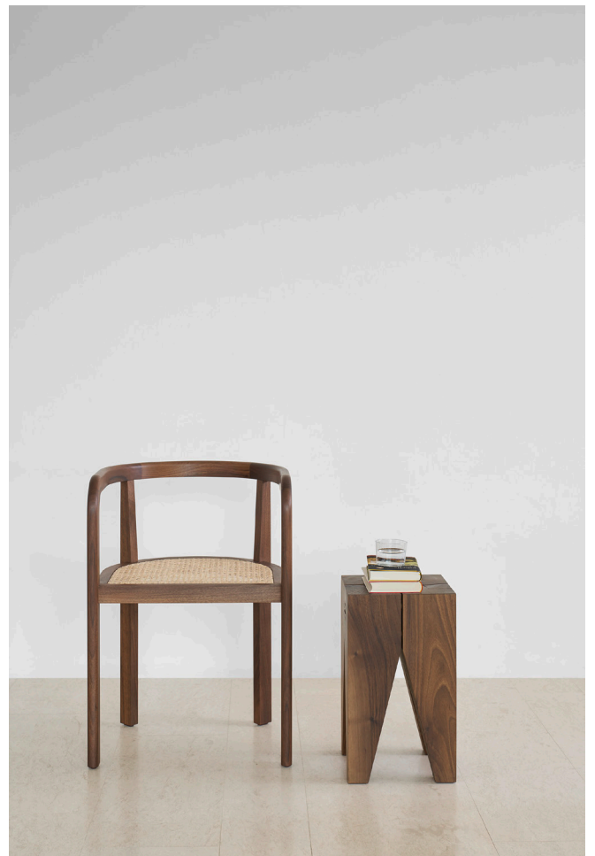
RH01 STUTTGART STUHL / CHAIR NUSSBAUM, GEWACHST / WALNUT, WAXED POLSTERUNG WIENER GEFLECHT / UPHOLSTERY VIENNA WEAVE ST04 BACKENZAHN HOCKER / STOOL