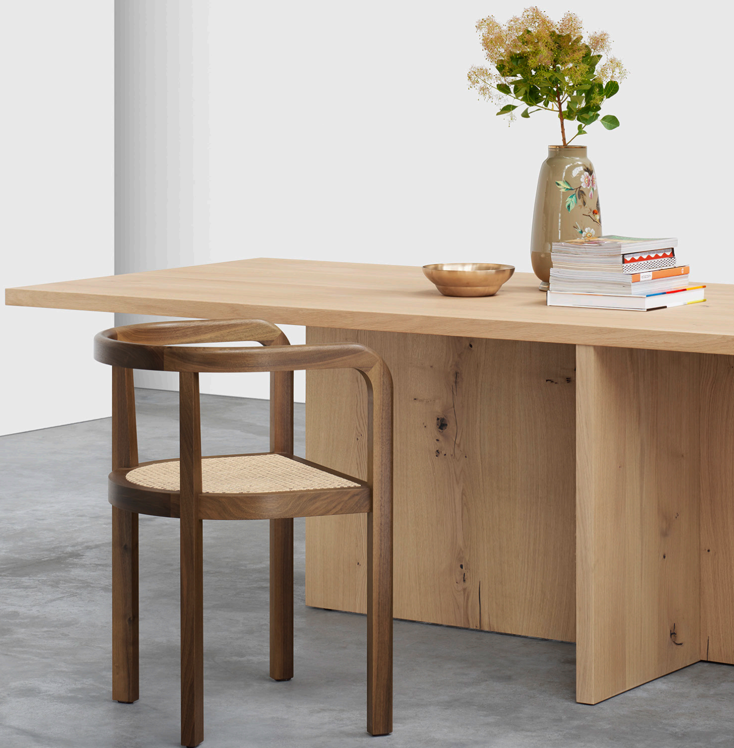
RH01 STUTTGART STUHL / CHAIR NUSSBAUM, GEWACHST / WALNUT, WAXED POLSTERUNG WIENER GEFLECHT / UPHOLSTERY VIENNA WEAVE TA18 ZEHN TISCH / TABLE