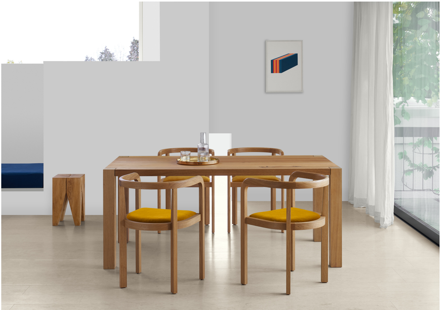
RH01 STUTTGART STUHL / CHAIR EICHE, GEWACHST / OAK, WAXED POLSTERUNG / UPHOLSTERY BYRAM OCHRE ST04 BACKENZAHN HOCKER / STOOL TA22 HOLBORN TISCH / TABLE CM06 HABIBI TABLETT / TRAY