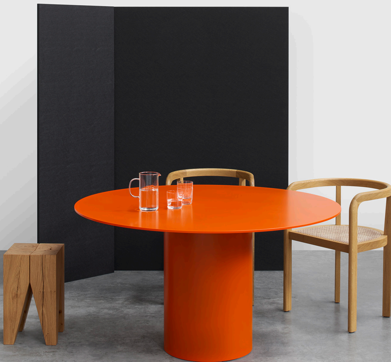
RH01 STUTTGART STUHL / CHAIR EICHE, GEWACHST / OAK, WAXED POLSTERUNG WIENER GEFLECHT / UPHOLSTERY VIENNA WEAVE TA20 HIROKI TISCH / TABLE ST04 BACKENZAHN HOCKER / STOOL