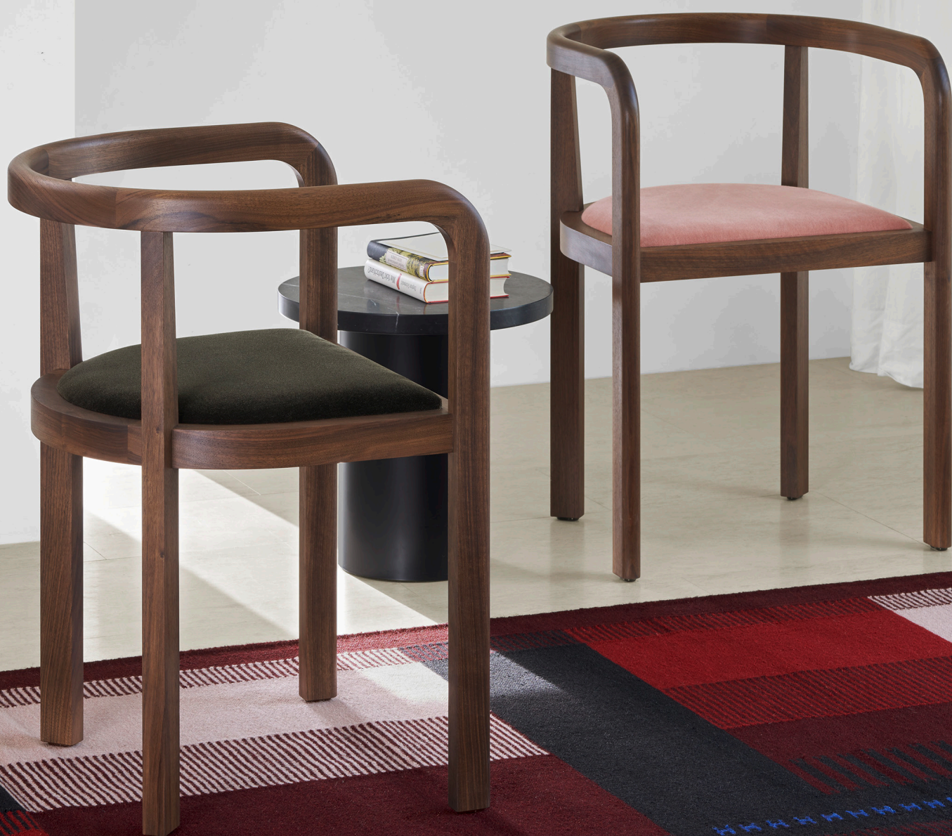
RH01 STUTTGART STUHL / CHAIR NUSSBAUM, GEWACHST / WALNUT, WAXED POLSTERUNG / UPHOLSTERY BYRAM ESPRESSO, ZANZIBAR SHELL PINK CT09 ENOKI BEISTELLTISCH / SIDE TABLE RH02 ZET KELIM / KILIM