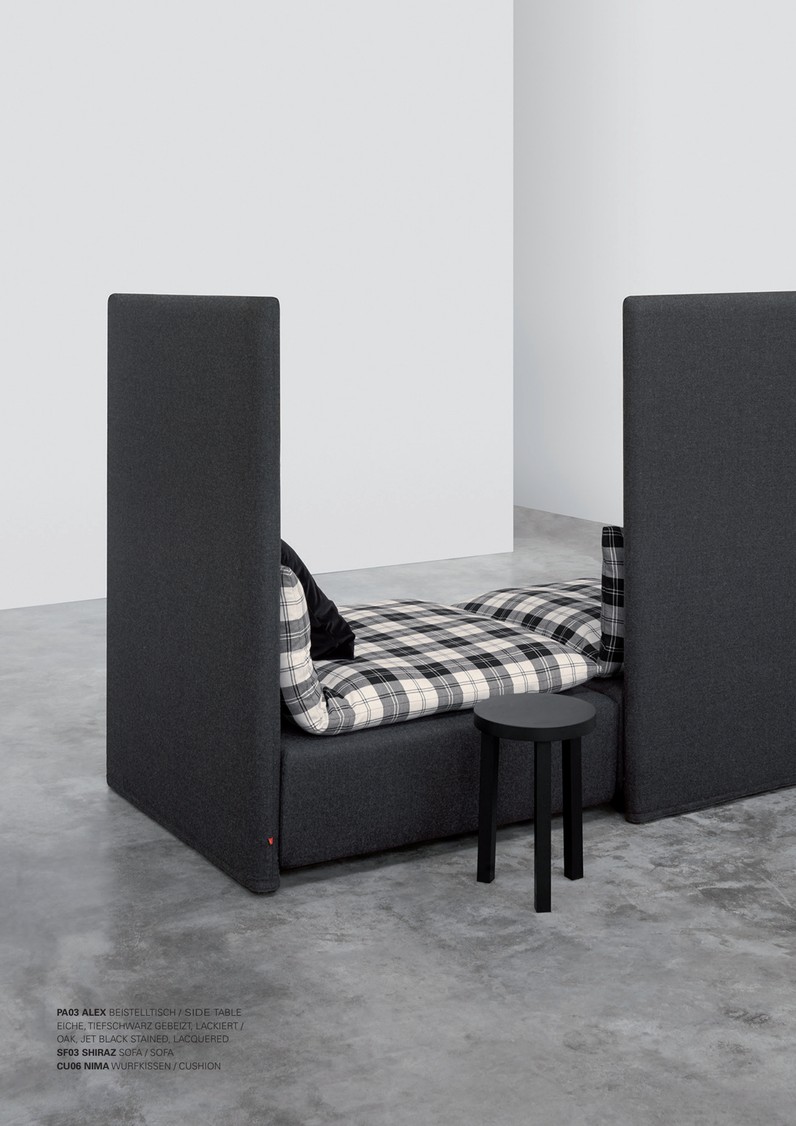
PA03 ALEX BEISTELLTISCH / SIDE TABLE EICHE, TIEFSCHWARZ GEBEIZT, LACKIERT / OAK, JET BLACK STAINED, LACQUERED SF03 SHIRAZ SOFA / SOFA CU06 NIMA WURFKISSEN / CUSHION