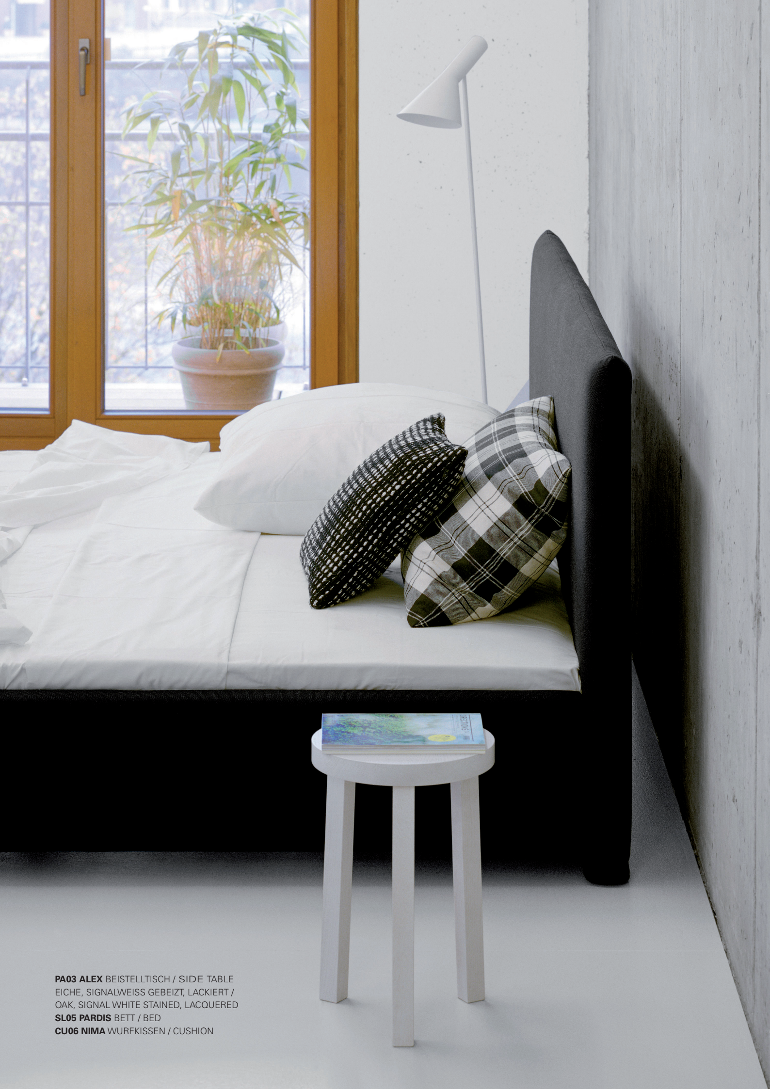
PA03 ALEX BEISTELLTISCH / SIDE TABLE EICHE, SIGNALWEISS GEBEIZT, LACKIERT / OAK, SIGNAL WHITE STAINED, LACQUERED SL05 PARDIS BETT / BED CU06 NIMA WURFKISSEN / CUSHION