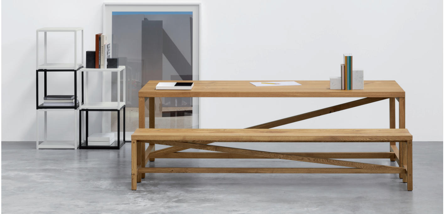
FK12 FORTYFORTY BEISTELLTISCH / SIDE TABLE STAHL, PULVERBESCHICHTET, SIGNALWEISS, TIEFSCHWARZ / STEEL, POWDER-COATED, SIGNAL WHITE, JET BLACK TA21 PLATZ TISCH / TABLE BE05 SITZ BANK / BENCH AC11 STOP BUCHSTÜTZE / BOOK END CM04 ITO TABLETT / TRAY