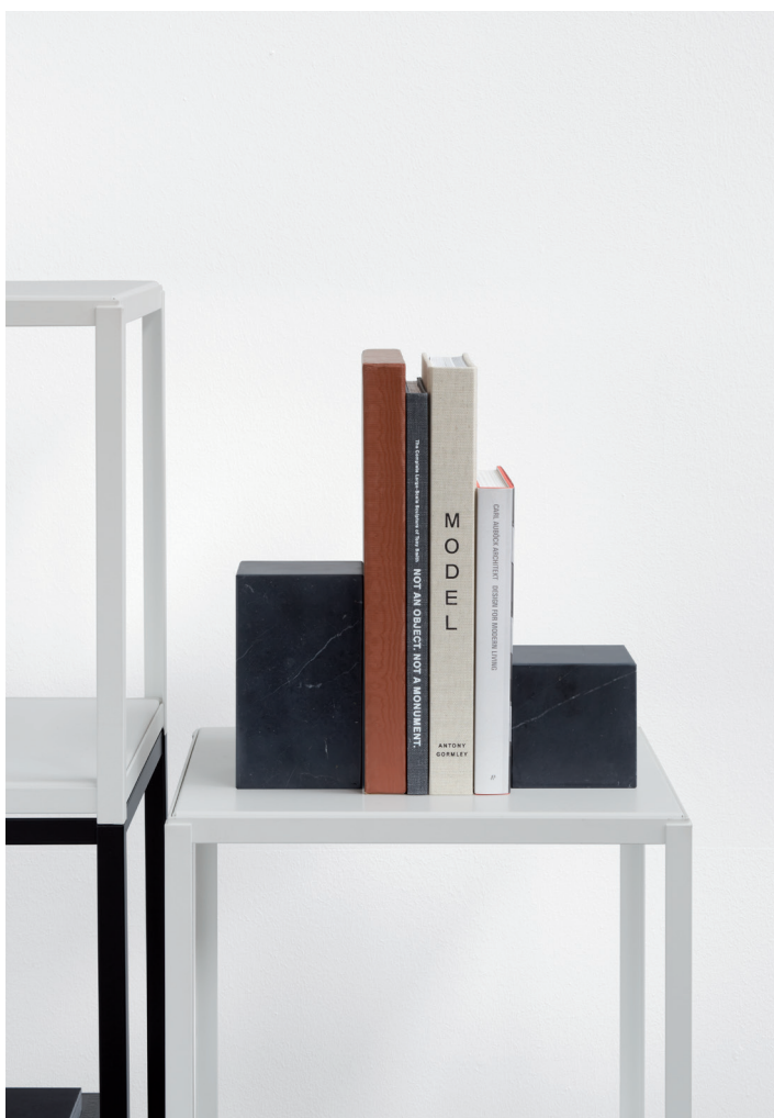
FK12 FORTYFORTY BEISTELLTISCH / SIDE TABLE STAHL, PULVERBESCHICHTET, SIGNALWEISS, VERKEHRSGRAU, UMBRAGRAU, LICHTBLAU, NAVY, MINT, FLAME / STEEL, POWDER-COATED, SIGNAL WHITE, TRAFFIC GREY, UMBRA GREY, LIGHT BLUE, NAVY, MINT, FLAME