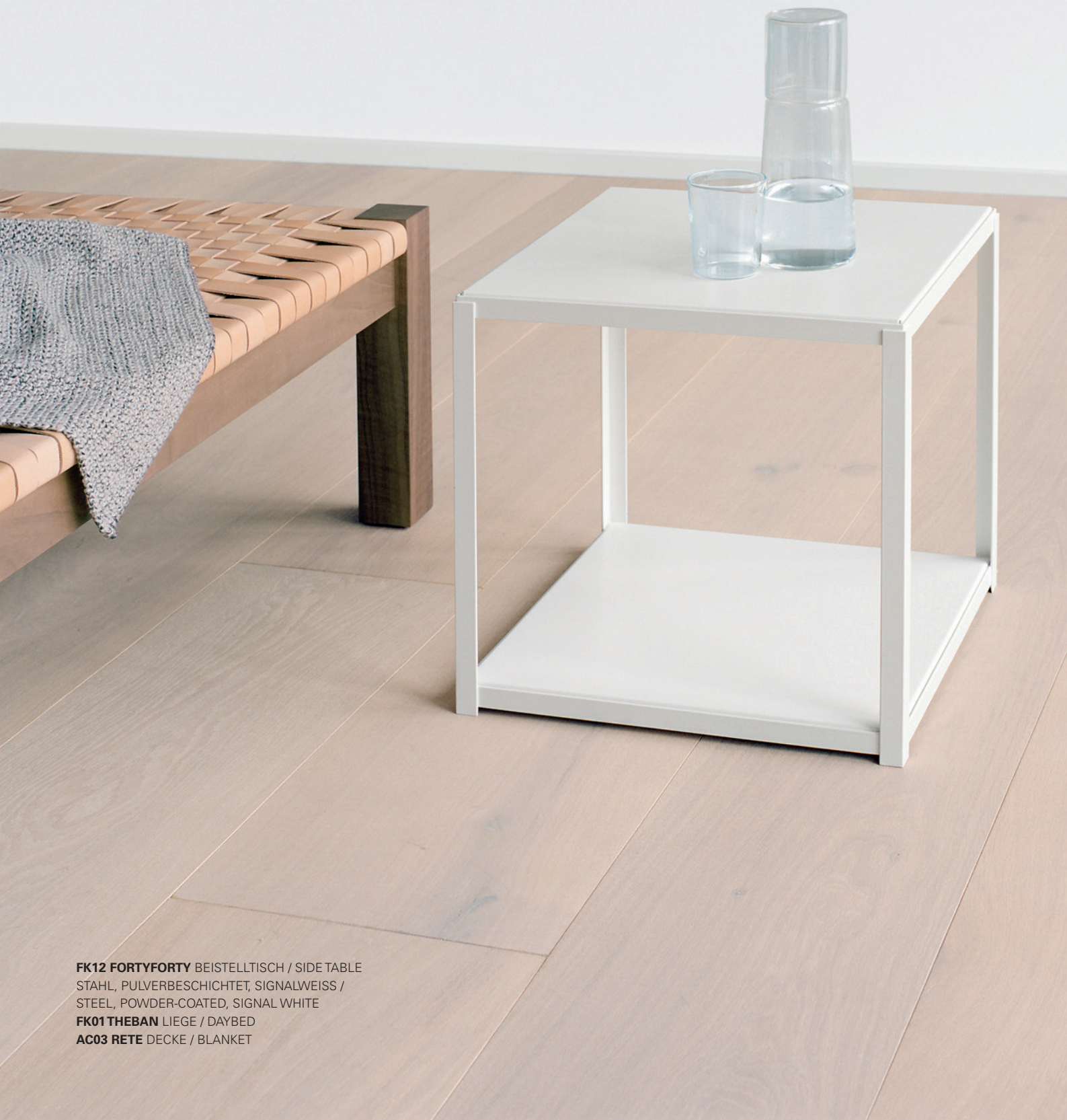
FK12 FORTYFORTY BEISTELLTISCH / SIDE TABLE STAHL, PULVERBESCHICHTET, SIGNALWEISS / STEEL, POWDER-COATED, SIGNAL WHITE FK01 THEBAN LIEGE / DAYBED AC03 RETE DECKE / BLANKET