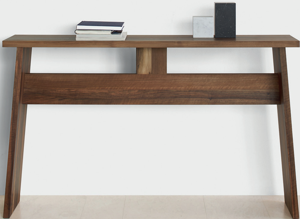
DC04 DRAYTON ANRICHTE / SIDEBOARD NUSSBAUM, GEÖLT / WALNUT, OILED AC11 STOP BUCHSTÜTZE / BOOK CP02 NEYRIZ KELİM / KILIM